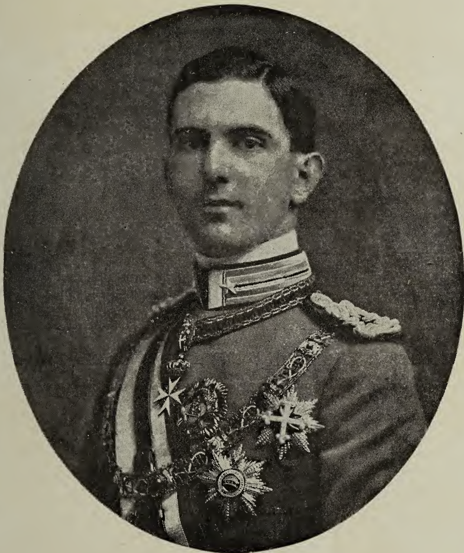
S. A. R. EL PRÍNCIPE HEREDERO DE LA CORONA DE ITALIA, HUMBERTO DE SABOYA